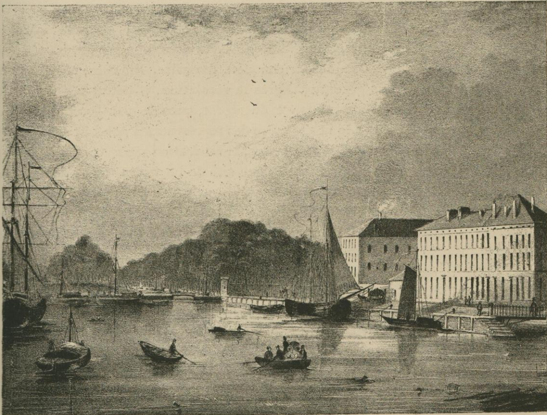
VUE DU BASSIN ET DE L'ALLÉE-VERTE.

On dut abandonner le vieil entrepôt qui s'élevait entre la rue de Laeken, d'une